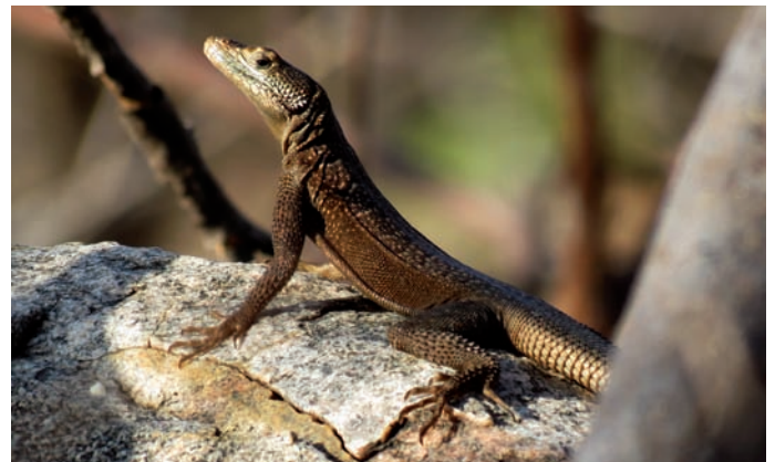
Tropidurus jaguaribanus , São João do Jaguaribe, CE.