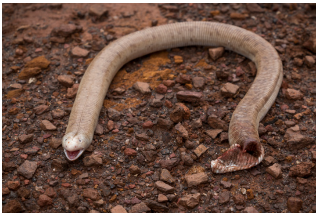
Figura 2. Indivíduo adulto de Amphisbaena alba (UFMG 3419) em postura defensiva, após a fuga do potencial predador ( Caracara plancus ). Note as dilacerações na porção caudal do animal, causadas pelo carcará.