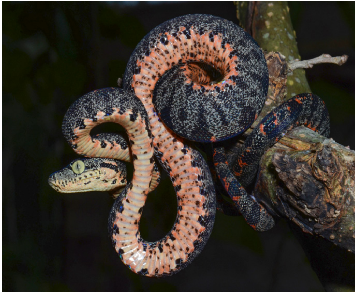
Corallus hostulanus Machadinho D Oeste, RO @Diego José Santana