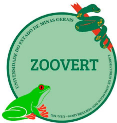
Figura 4. Com o intuito de dar maior visibilidade para a herpetofauna, escolhemos um anuro e uma serpente para compor a nossa logomarca, pois trata-se de um grupo de vertebrados muito negligenciado e perseguido, presente em lendas e mitos que povoam o imaginário popular.

Por este motivo, em 2020, percebemos a necessidade da criação da nossa identidade visual (Fig. 4) e de fundarmos a nossa primeira mídia social (@zoovertuemguba). Com linguagem simples e voltada para a população em geral, divulgamos no espaço virtual os resultados de nossos projetos, relatos das ações periódicas da equipe e conteúdos autorais relacionados aos saberes científicos e populares. Os textos produzidos visam reforçar e popularizar o conhecimento sobre a fauna de vertebrados e favorecer a proteção dos recursos naturais, além de procurar desmistificar o imaginário popular em relação à fauna silvestre (Fig. 5).