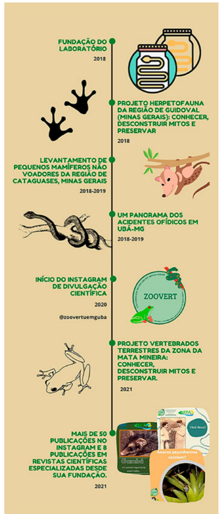
Figura 5. Linha do tempo do ZooVert Lab, resumando marcos históricos principais desde sua fundação.