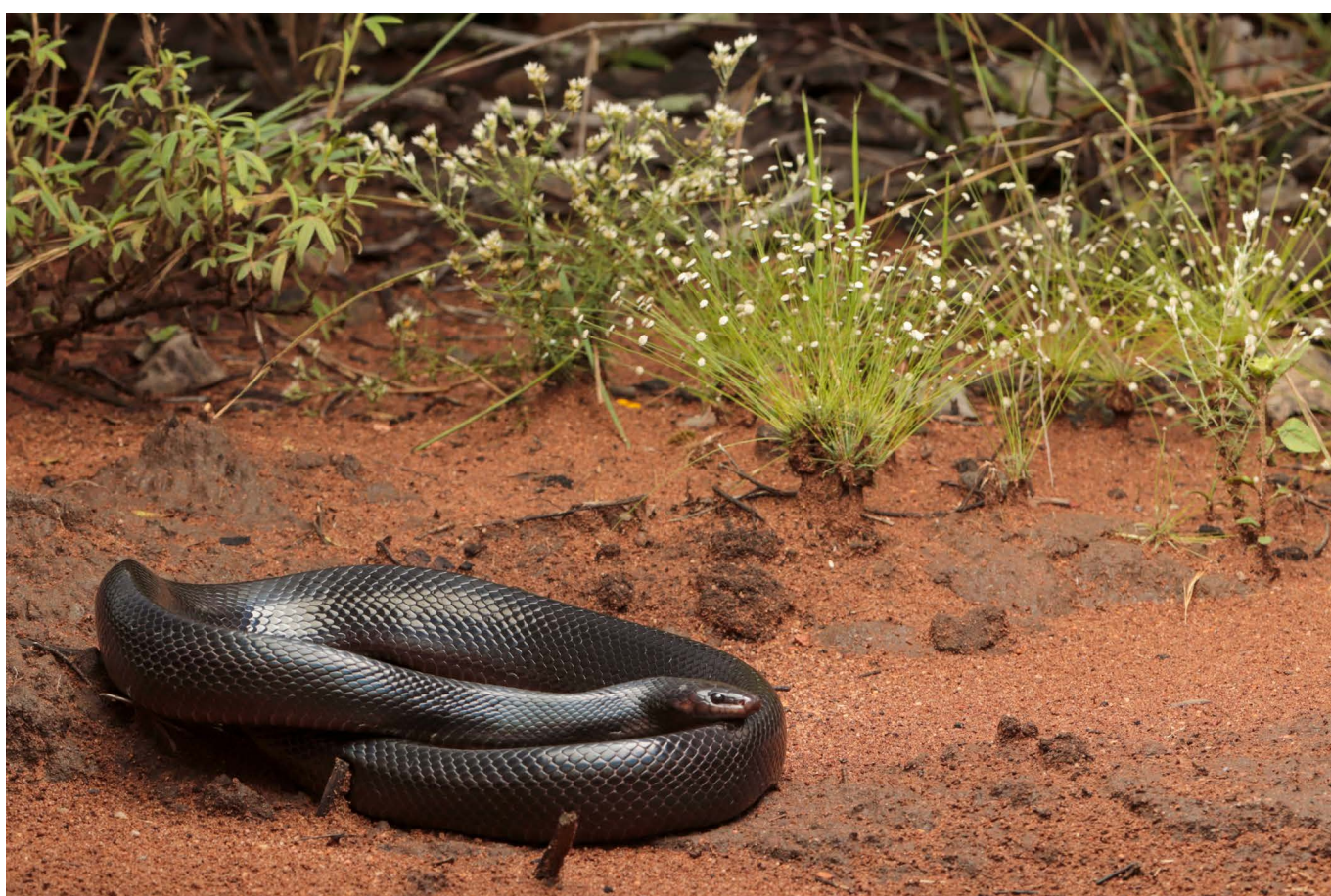
Rhachidelus brazili Alto Paraíso de Goiás, GO