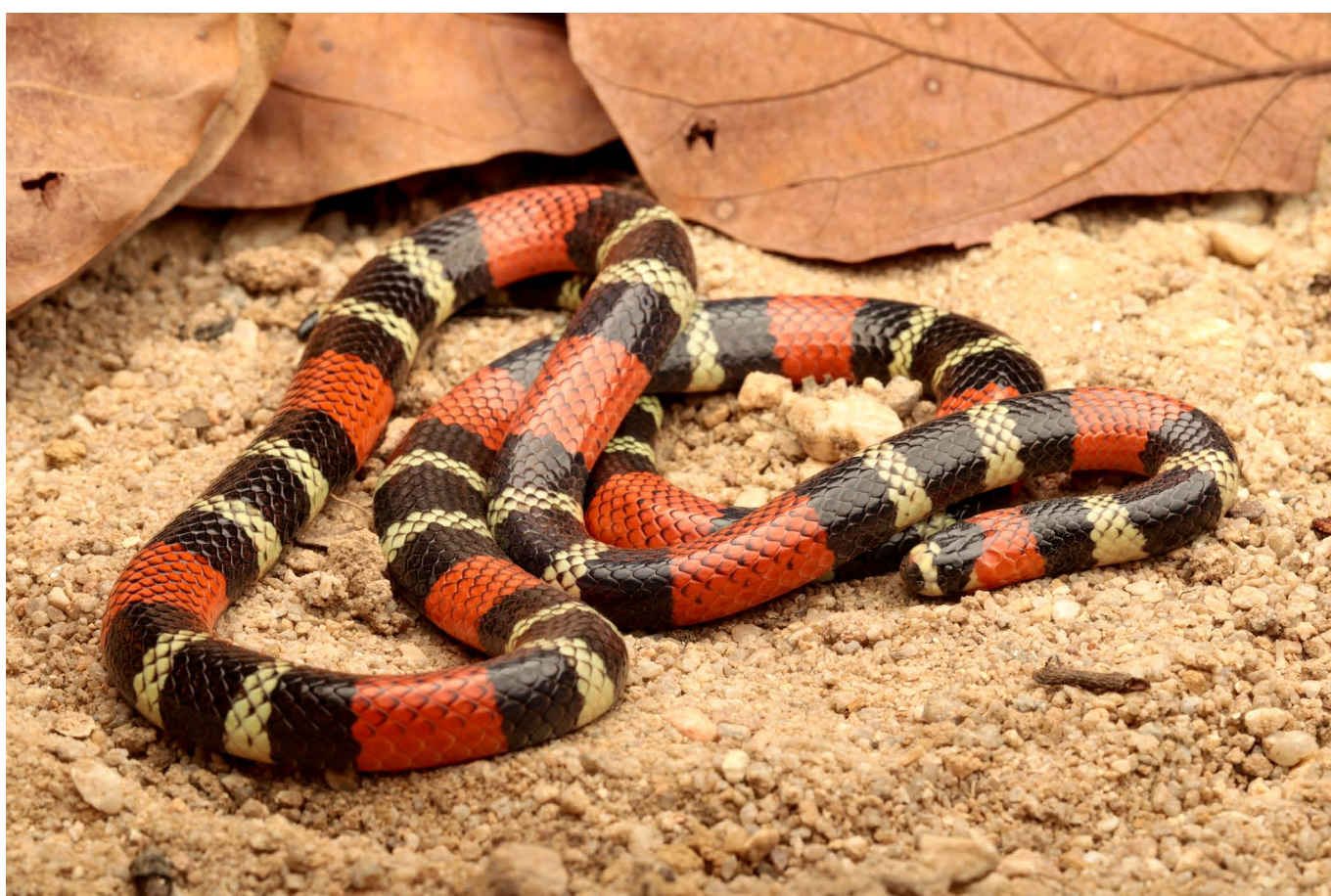
Micrurus carvalhoi Brasília, DF