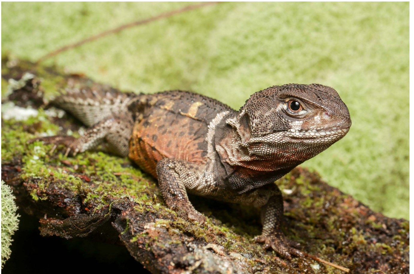
Hoplocercus spinosus Sapezal, MT