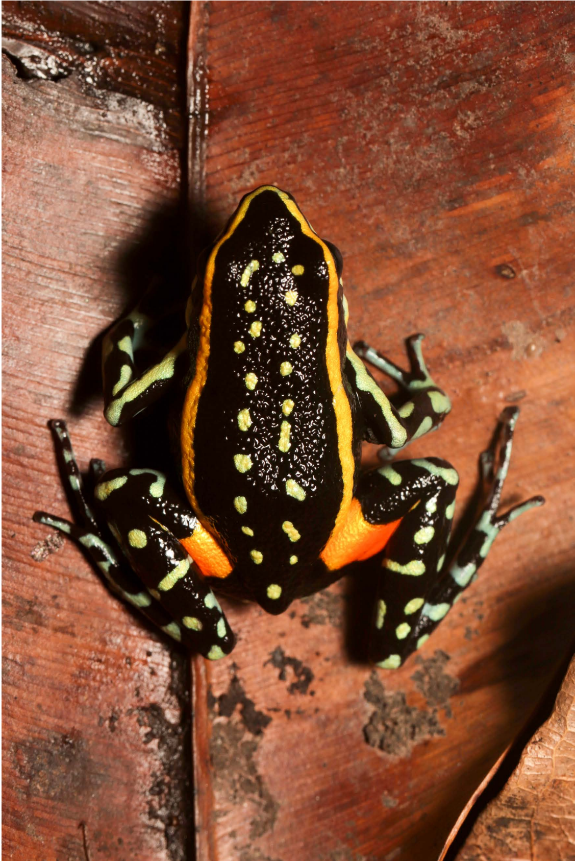
Ameerega flavopicta Alto Paraíso de Goiás, GO