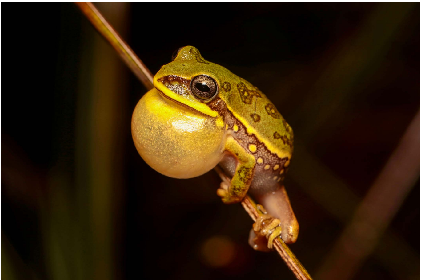
Boana ericae Alto Paraíso de Goiás, GO