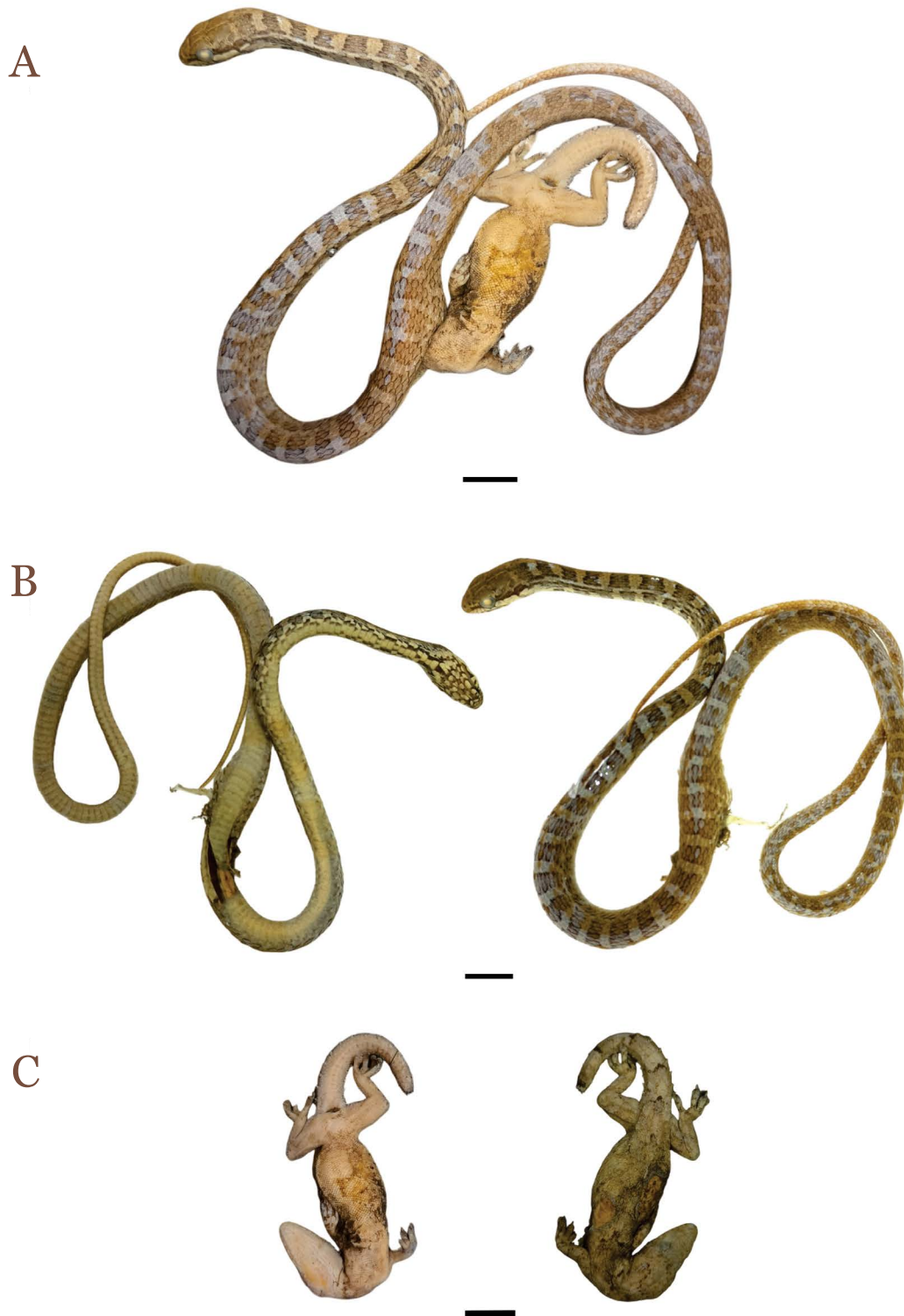
Figura 1. Mastigodryas boddaerti UFOPA-H 3352 found dead after feeding on Hemidactylus mabouia . A - Mastigodryas boddaerti with Hemidactylus mabouia expelled from the side of the body. B - Dorsal and ventral views of Mastigodryas boddaerti . C - Dorsal and ventral view of Hemidactylus mabouia .