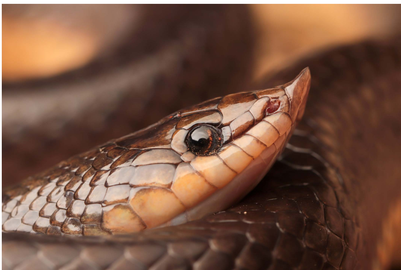
Phimophis guerini Brasília, DF