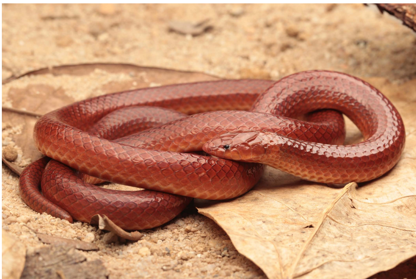
Phalotris nasutus Brasília, DF