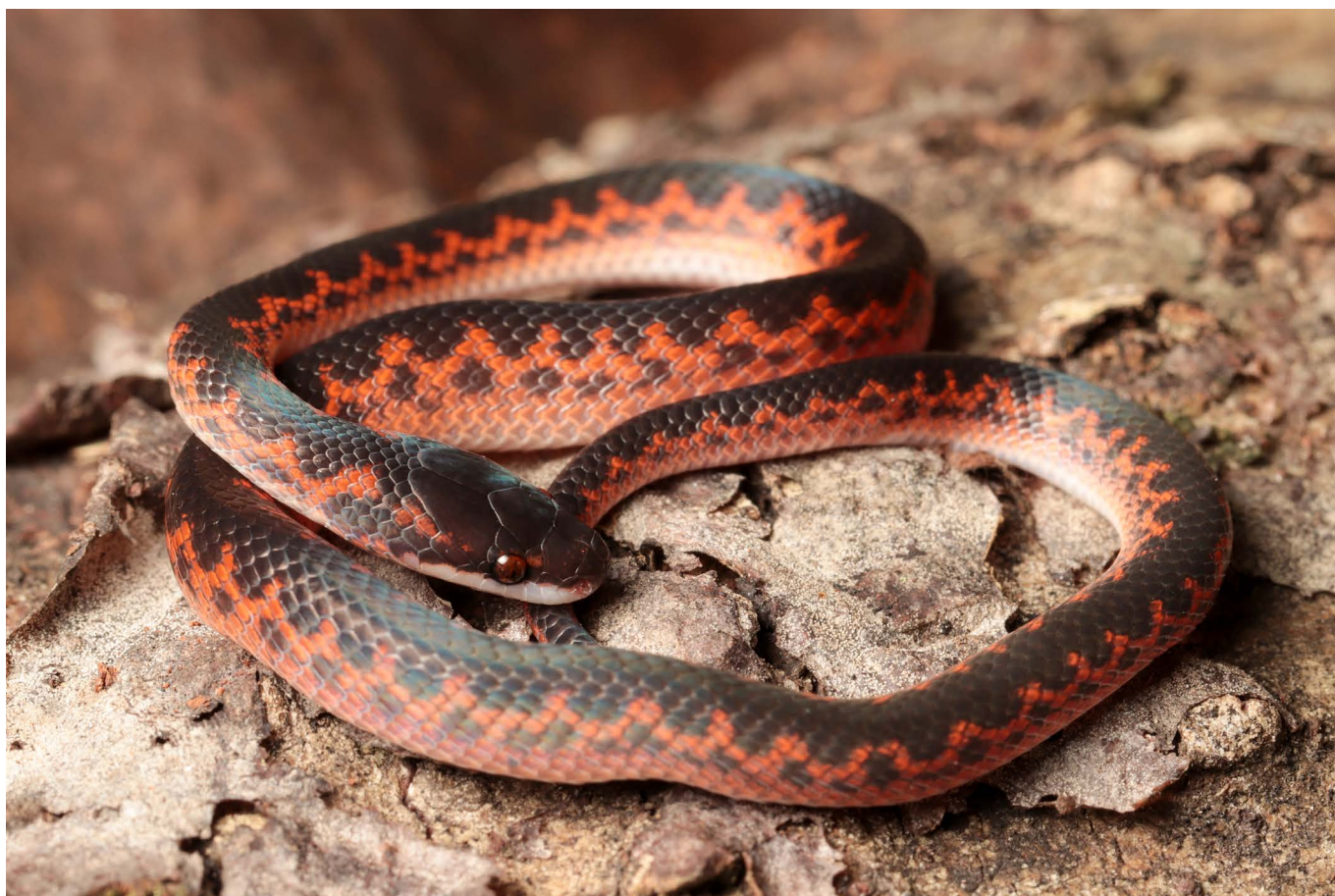
Xenopholis undulatus Brasília, DF @ Afonso Meneses