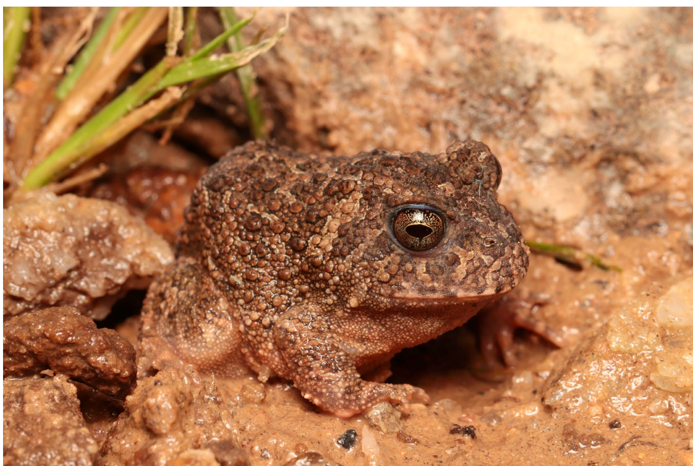
Proceratophrys moratoii Parque Nacional Serra da Canastra, MG