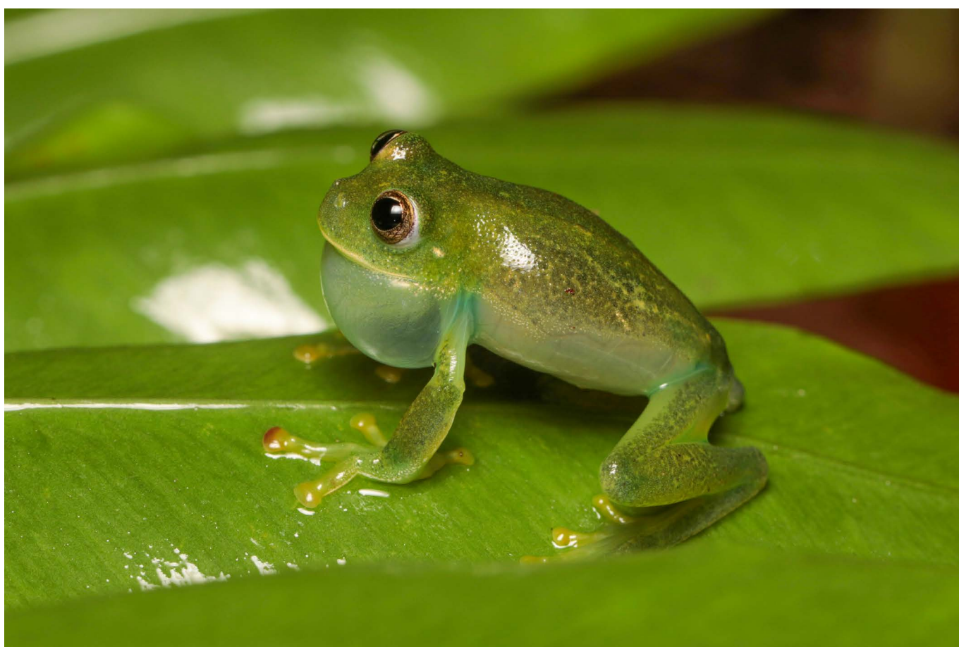
Vitreorana franciscana Parque Nacional da Serra da Canastra, MG