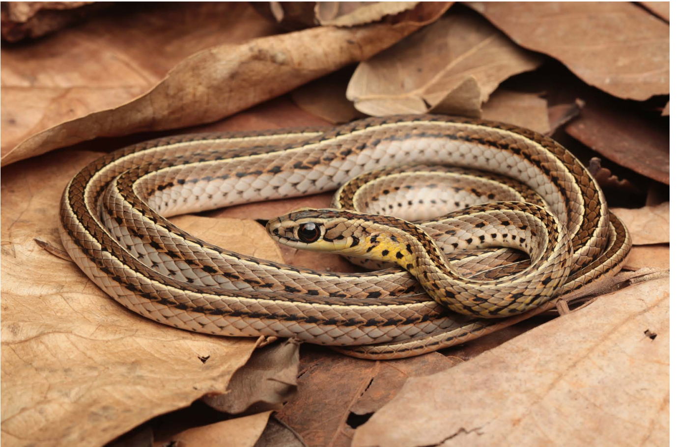
Lygophis meridionalis Brasília, DF @ Afonso Meneses