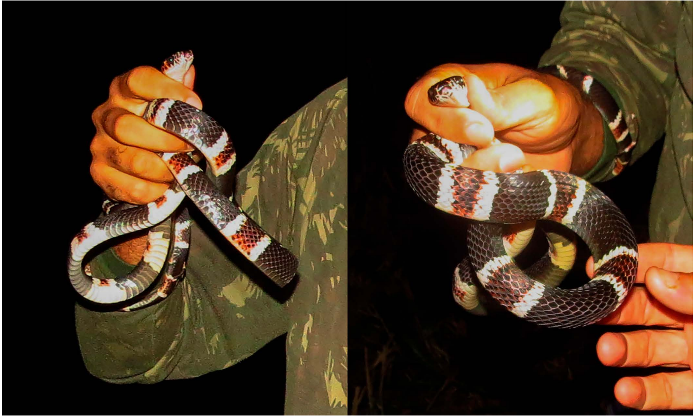
Figura 1. Specimen of Rhinobothryum lentiginosum from Santa Fé do Araguaia, state of Tocantins.