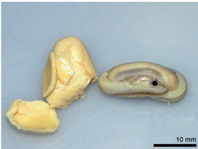
Figura 1: Embrião de Xenopholis undulatus 53 dias após postura, no estágio 36 de desenvolvimento, segundo método de Zehr (1962).

No dia 23 de dezembro (53 dias após a postura), um dos ovos (30,8 × 10 mm) apresentava um inchaço central, com enfraquecimento da casca coriácea, resultando em vazamento dos fluidos internos. Posteriormente, o ovo aparentou ressecamento, sendo então aberto. Um embrião em estágio 36 de desenvolvimento (Zehr, 1962) encontrava-se em seu interior (Figura 1).