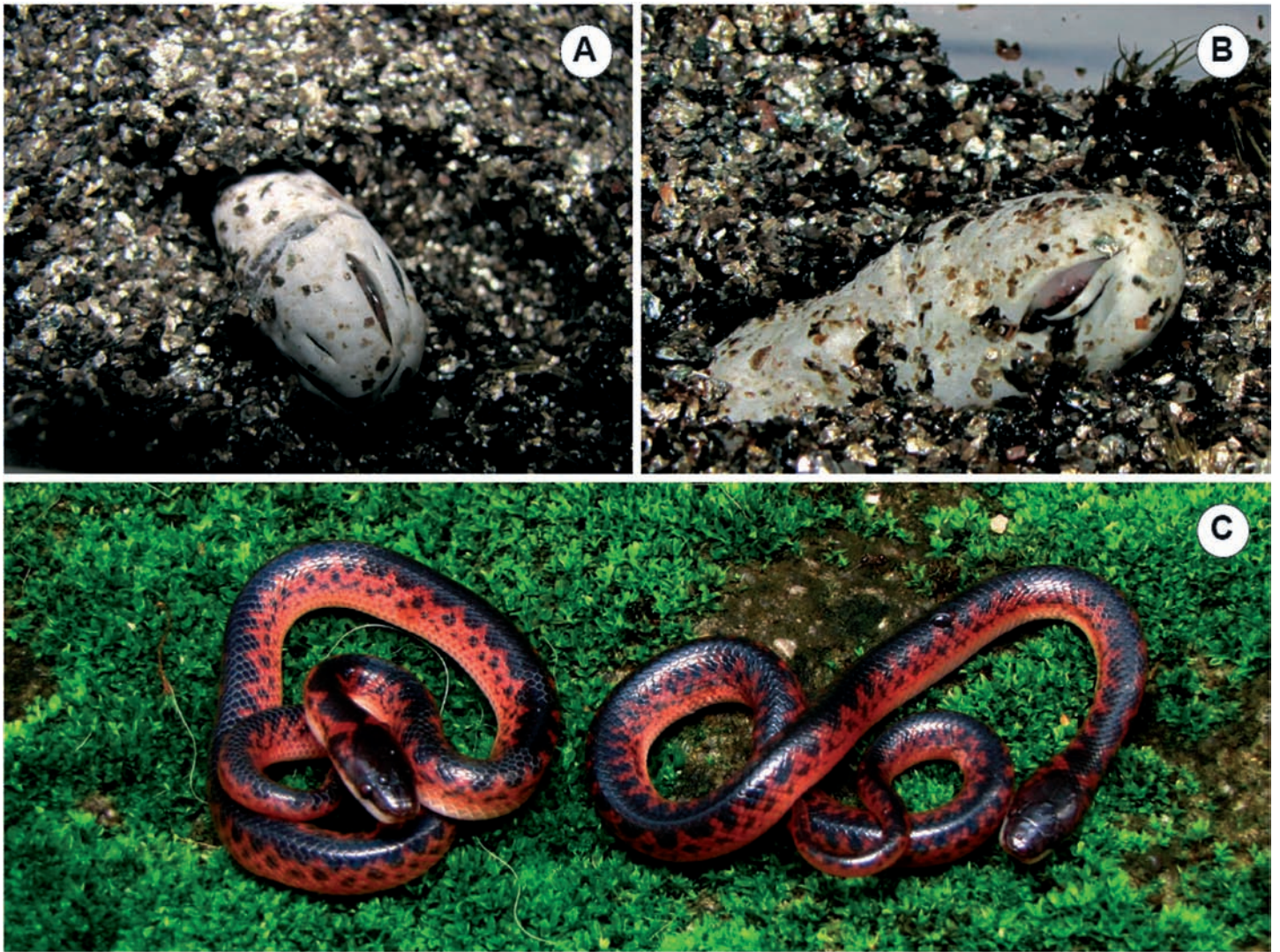
Figura 2: (A e B) Momento em que os filhotes de Xenopholis undulatus começam a eclodir; (C) Os dois filhotes após nascimento. As imagens não possuem a mesma escala.