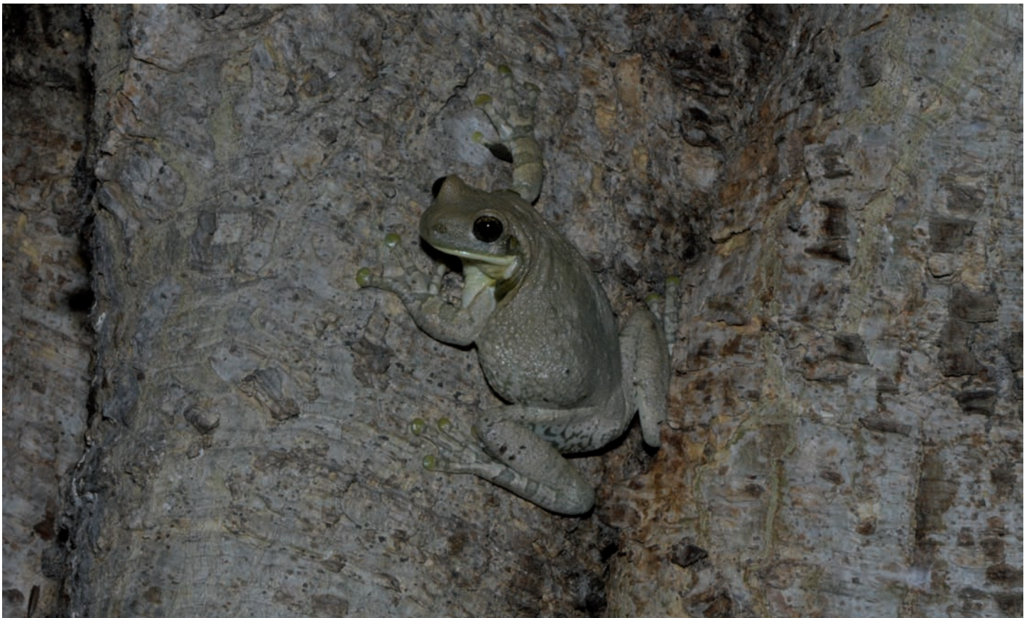
Trachycephalus venulosus , Miranda, MS (Foto: M. Martins).